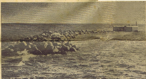
Molehovederne til den nye havneindsejling i Øster Hurup er dukket op af havet.

— Tja, nu har bundgarnsfiskerne endelig faaet udvidet 3 miles grænsen til 4 sømil, men det er