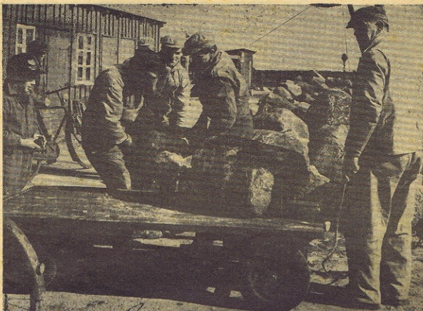
Kampenstenene til de nye moler er ikke saadan lige at pufte i lommen. Her bakes de over paa en blok-vogn, og derfra hejses de ned paa lægteren.

heller ikke for tidligt, siger havnefogeden. Det har knebet med at faa sejlet steu hertil, men saa faar vi dem i stedet for med lastbiler, og nu er der, som det ses, fuld gang i arbejdet.