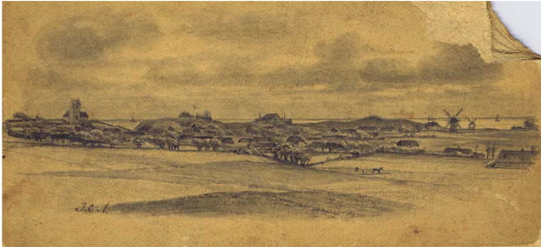
Als år 1897, med de to møller, Als mølle og ”Strandmøllen”.