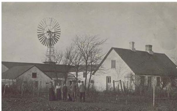
Als Oddevej 8.

I årene umiddelbart op imod første verdenskrig gik der en udbredt raptus over alle bønder paa egnen med anskaffelse af eget mølleri hjemme. Det var dels vindmotorer og dels petroleumsmotorer, selv mindre brug gik med her.