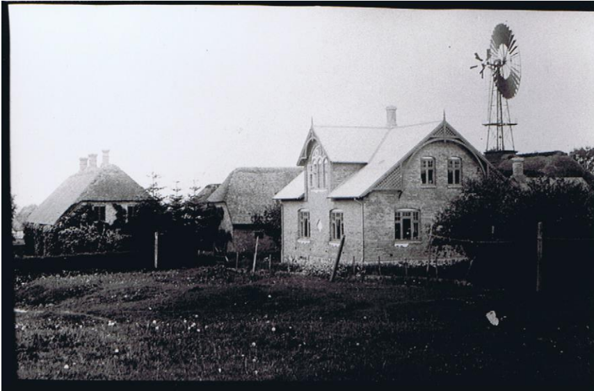
Teglgården med Justesens villa i forgrunden. Her ligger plejehjemmet i dag.

På laden ses den typiske vindmølle som næsten alle gårde på den tid havde. Vindmøllen var indtil elektriciteten kom, gårdenes eneste energikilde. Vindmøllerne havde den store ulempe, at de kun kunne fungere, når der var tilstrækkelig med vind. Så på trods af, at elektricitet i trediveerne var meget dyrt, blev vindmøllerne revet ned og erstattet med el motorer og elektrisk lys. Teglgården blev revet ned i 2005 og plejehjemmet "Teglgården" bygget på grunden.