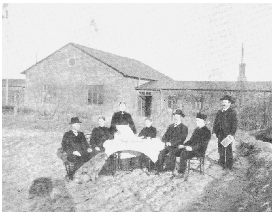
Afholdshjemmet fotograferet o. 1900