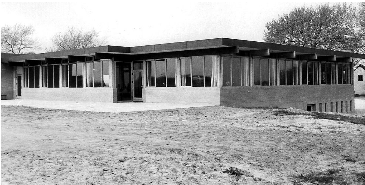
Det nye A-center, indviet 6. september 1975 .