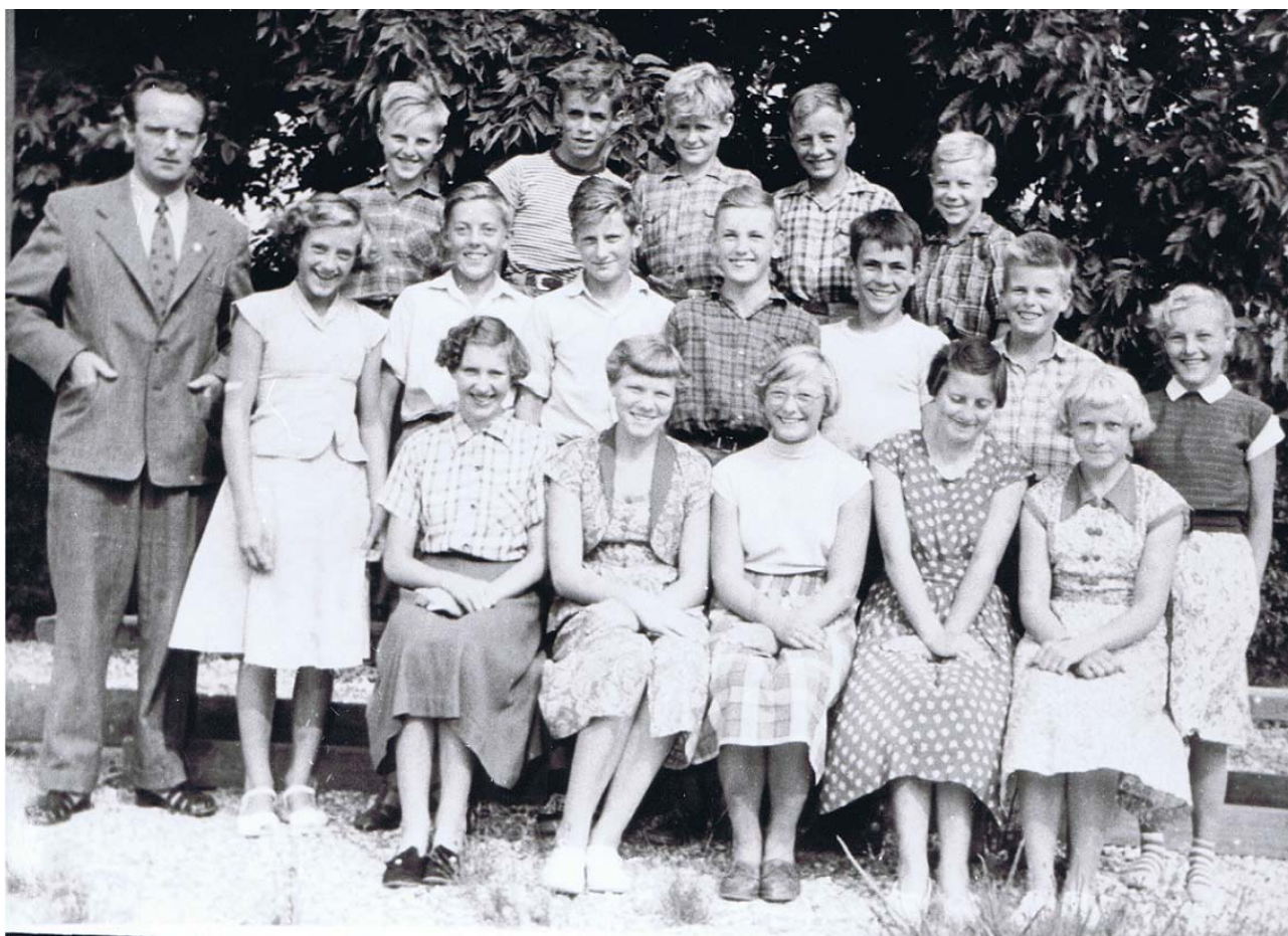
Als gamle skole ca.1955-56.