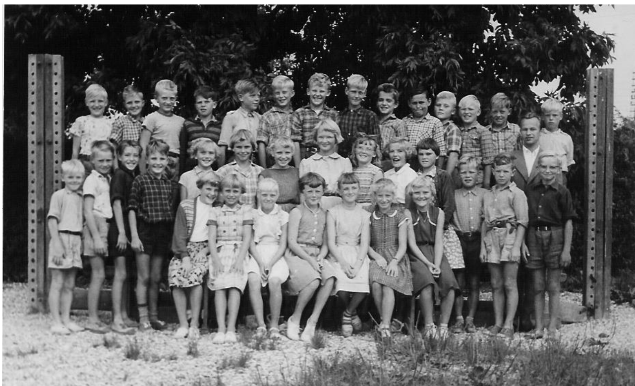
Als gamle skole 3-4 klasse 1955-56