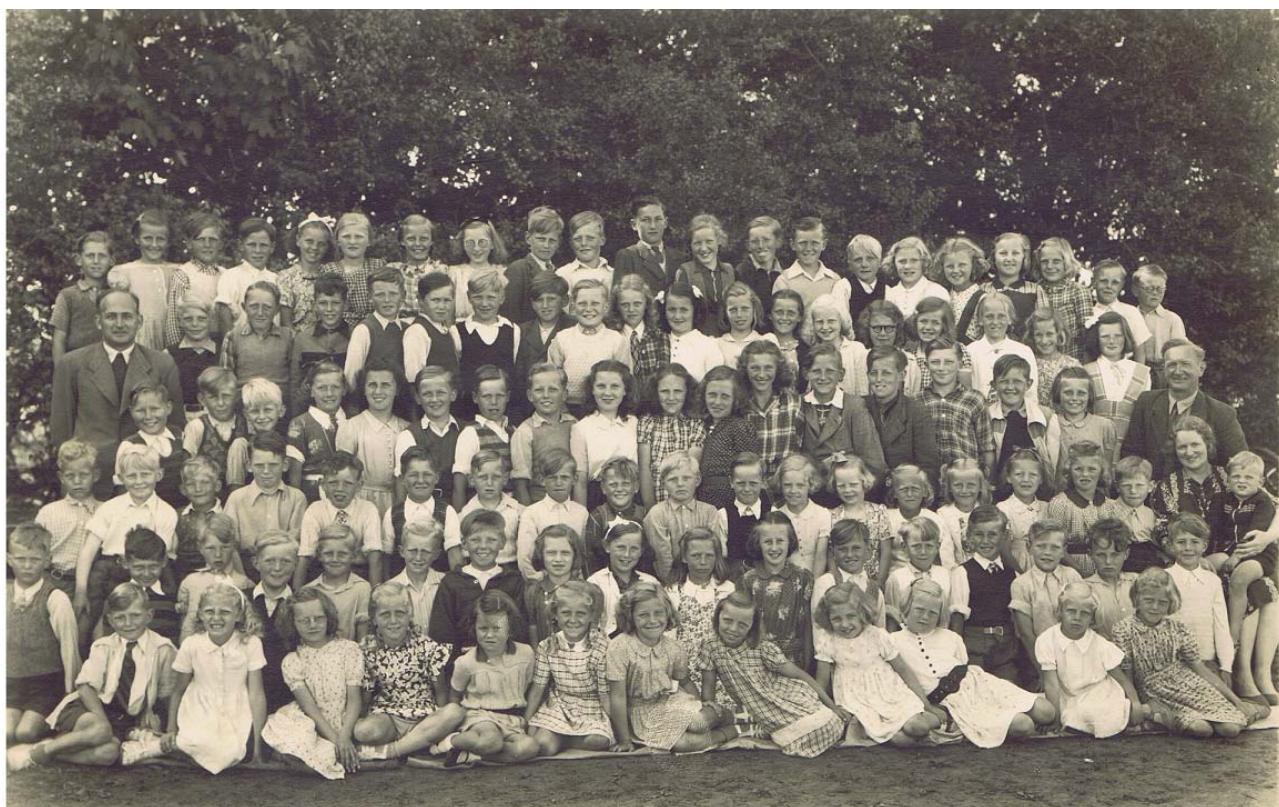
Als gamle skole 1947. Alle skoleelever.

Eleverne er genkendt og navne påsat med stor velvilje og hjælp fra: