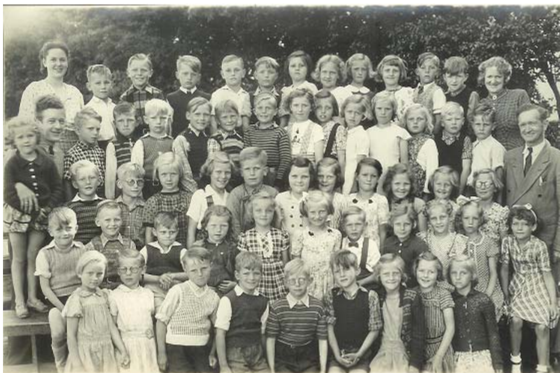
Als gamle skole. Elever år 1949.