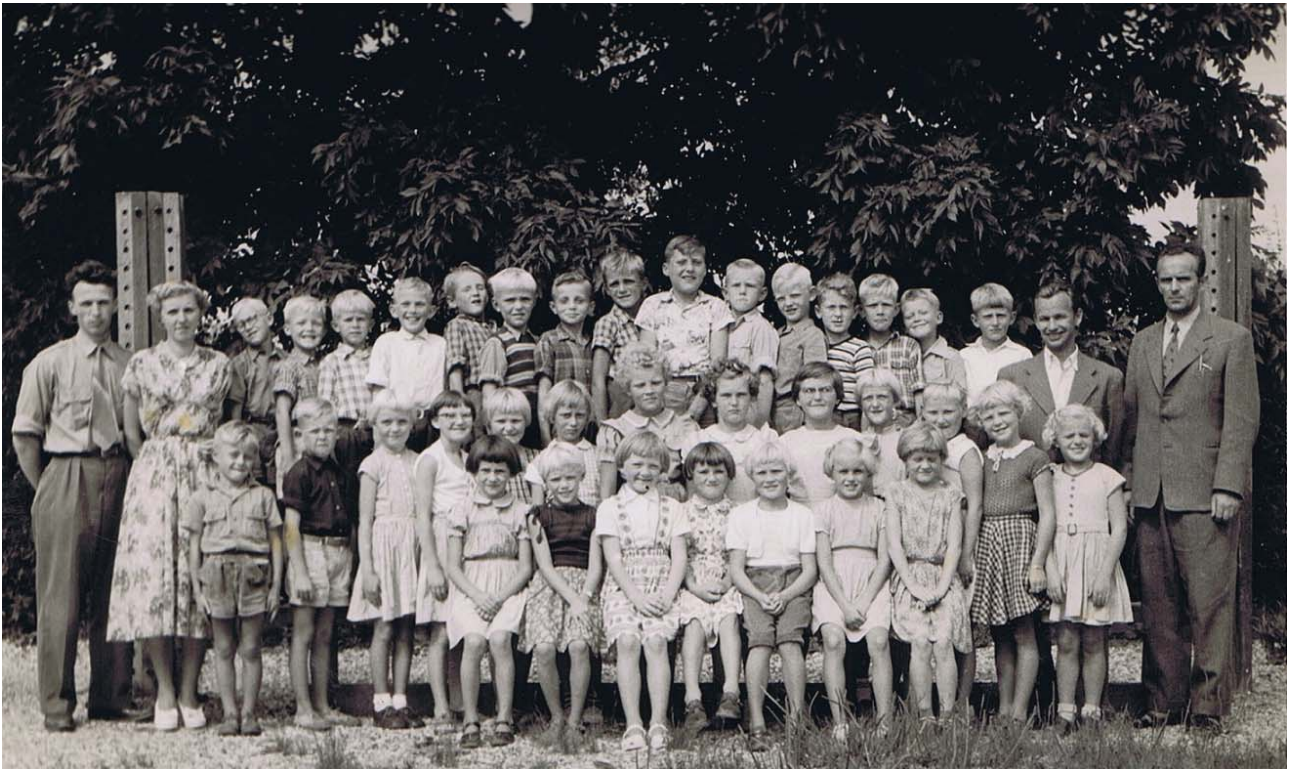
Als gamle skole 1-2 klasse 1954-55