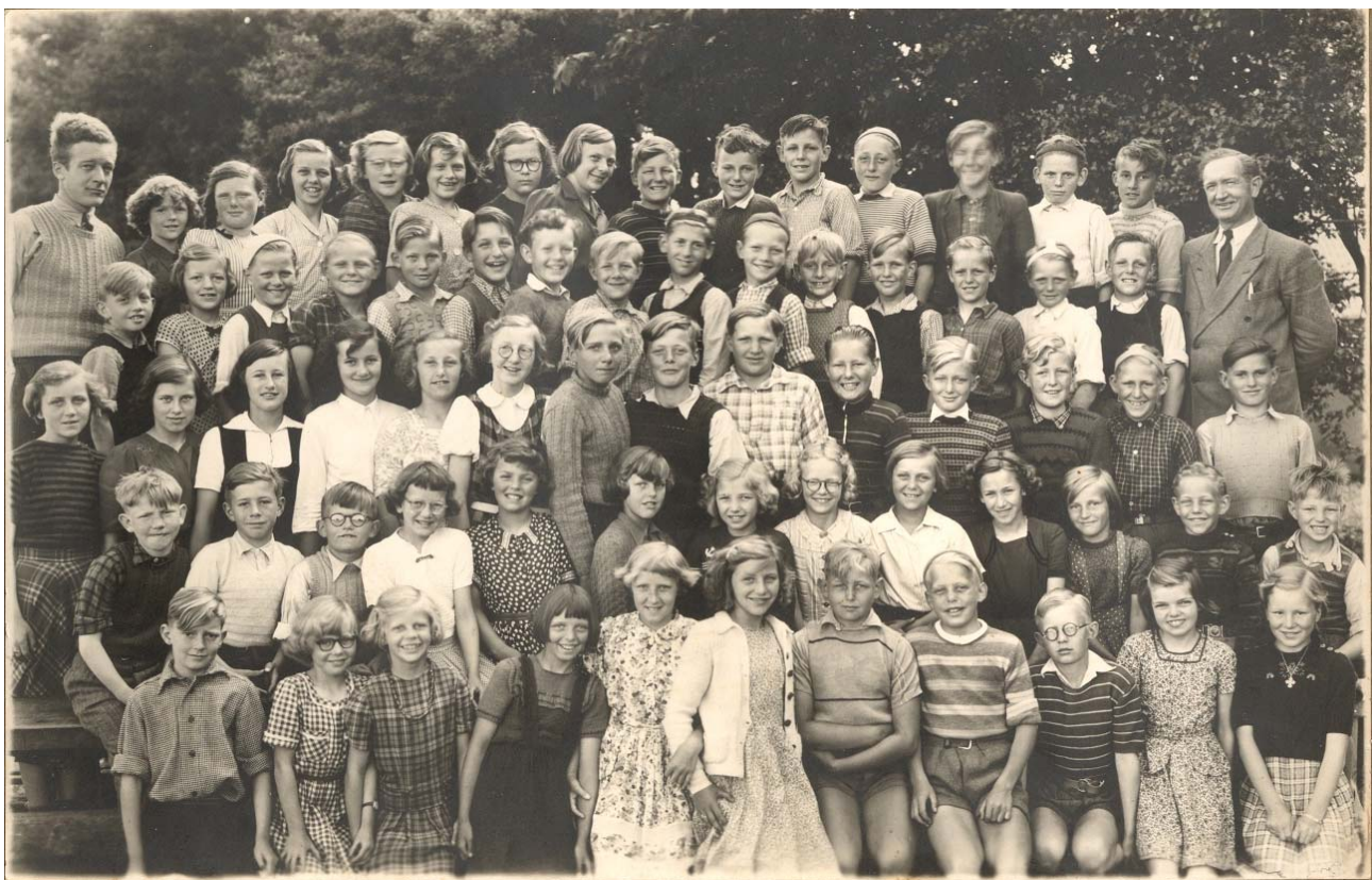
Als gamle skole 1950. Alle skoleelever.