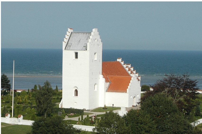
Als kirke, set fra vest

Als sogns absolut ældste bygning, Als kirke, kan efter de oplysninger, der findes tidsfæstes til at være opført i 1309, idet der på et tidspunkt har været indridset i kirkens nordside "anno 1309".