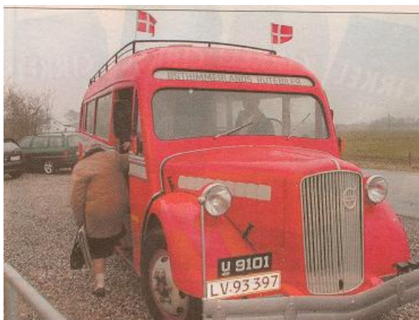
Året er 2003. Danmarks ældste Volvo bus.

I december 1983 blev U 9101 hentet af hus, da man skulle have en ny Volvo-bus - den første i 24 år - og den gamle og den nye bus blev selvfølgelig forevigt sammen. Men siden blev den atter kørt i hus - og da der med to bybusser på linje 20 ikke mere var plads til den i Dokkedal, fandt man andre, midlertidige, pladser til den. Ved garageudvidelsen i Dokkedal fik den atter plads der, men først op til bygningen af det nye garageanlæg i Als - og vognens 50-år - kom der realiteter bag tankerne om restaurering. Med sagkyndig hjælp »ude i byen« blev vognen klar med pladearbejde og ny lak til at kunne præsentere sig ved garageindvielsen 29. september, 1988.