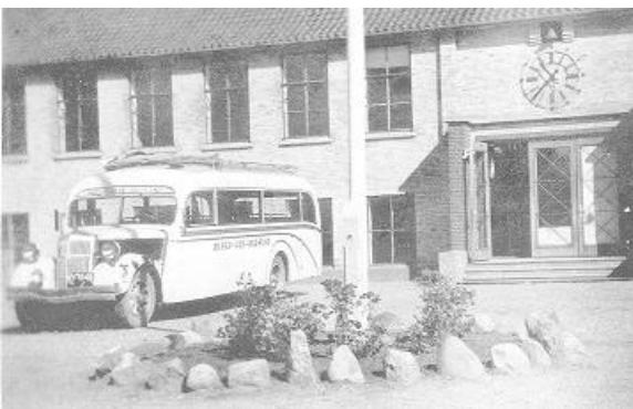
Samme REO 1929 med nyt karrosseri 1936