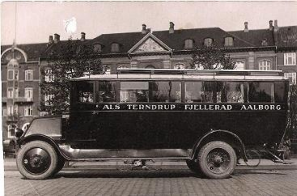
1924 Rutebil i Aalborg