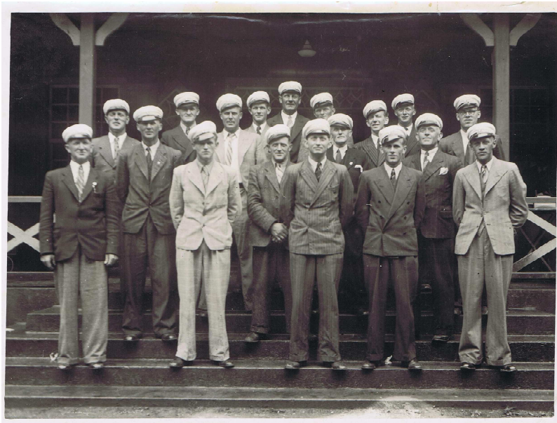
Als mandekor ca. 1940.