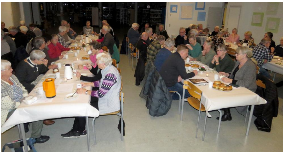
Et kig ud over forsamlingen