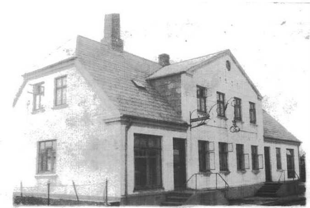
Bageri og slagter – Hadsundvej 13-15