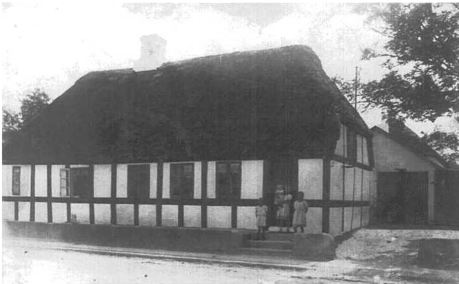
Huset før bageri og slagter